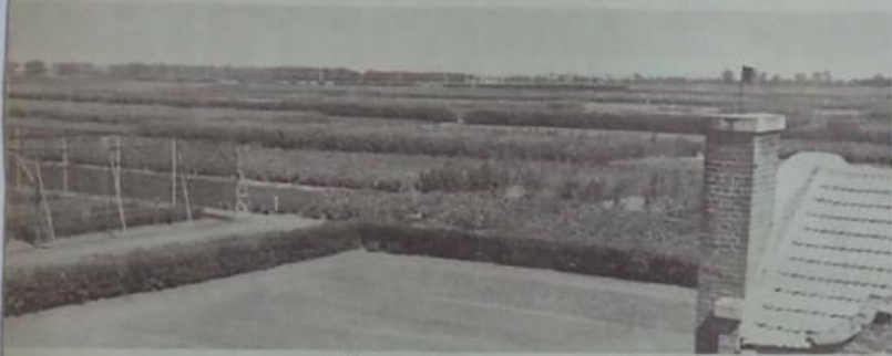
色銀農之大軍水實。四三三約價出總一第之調後

農事試驗場。於去年(一九二七)年。改稱農事試驗場。其試驗場。自於去年(一九二五)年。即由農事試驗場。改稱農事試驗場。自於去年(一九二五)年。即由農事試驗場。改稱農事試驗場。