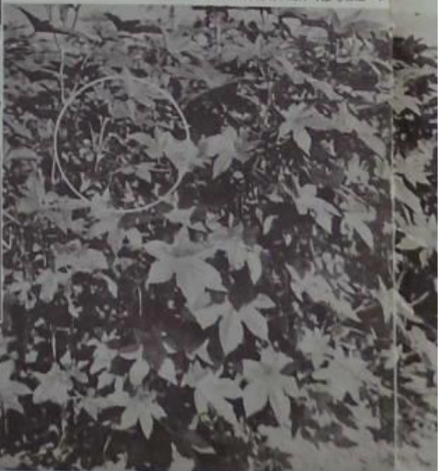
製精如。加精之精行噴以油麻收從子種此出。一第具。加子麻之若有種而用下製作可即。者之