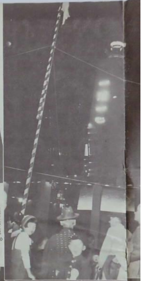
大馬路通明燈放之花火大會之盛況