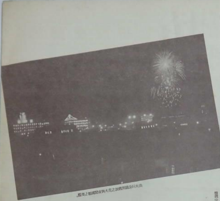
大馬路通明燈放之花火大會之盛況