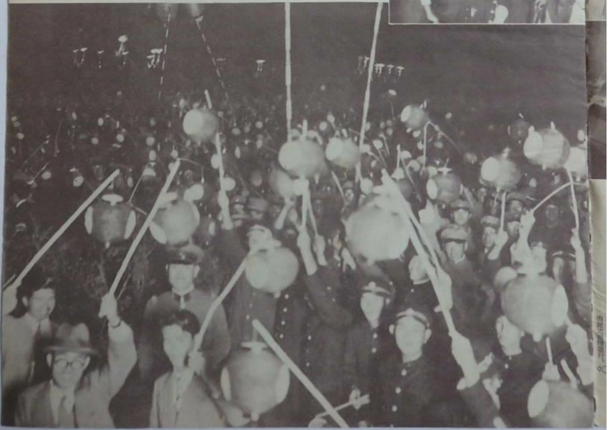
大馬路通明燈放之花火大會之盛況