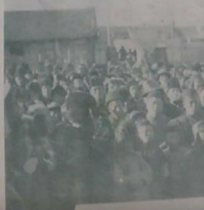
「讀讀」 「上這」 「切事」 「不可」 「忘助」 「之款他」 「有者」