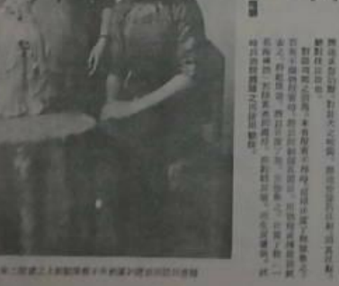
本報記者攝於上海南京路之某婦女