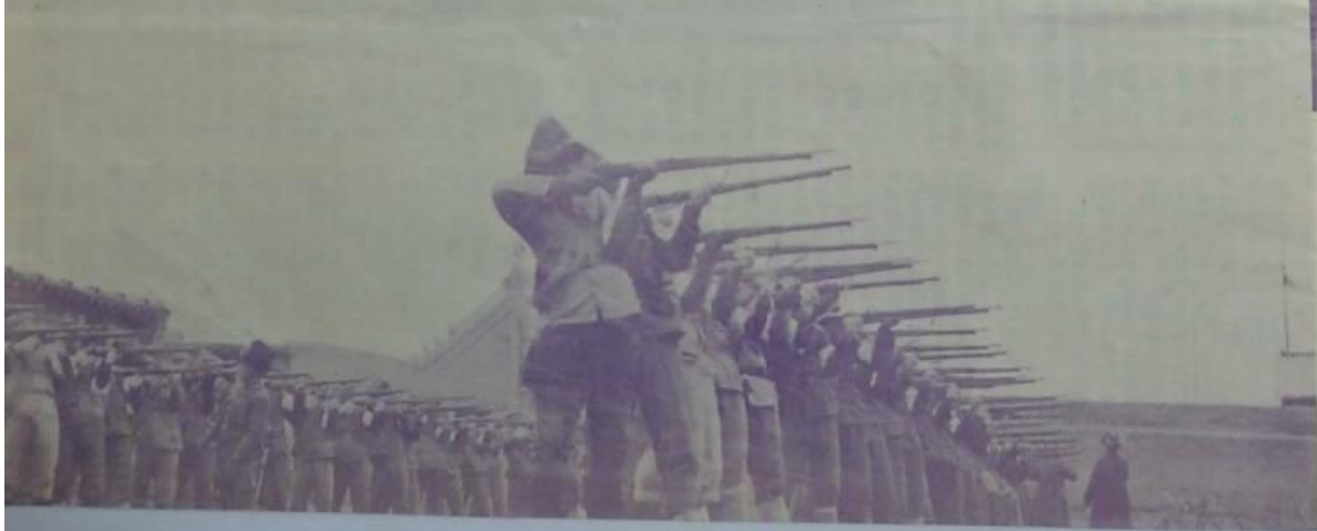
自衛團之訓練器材特事從下舉助於