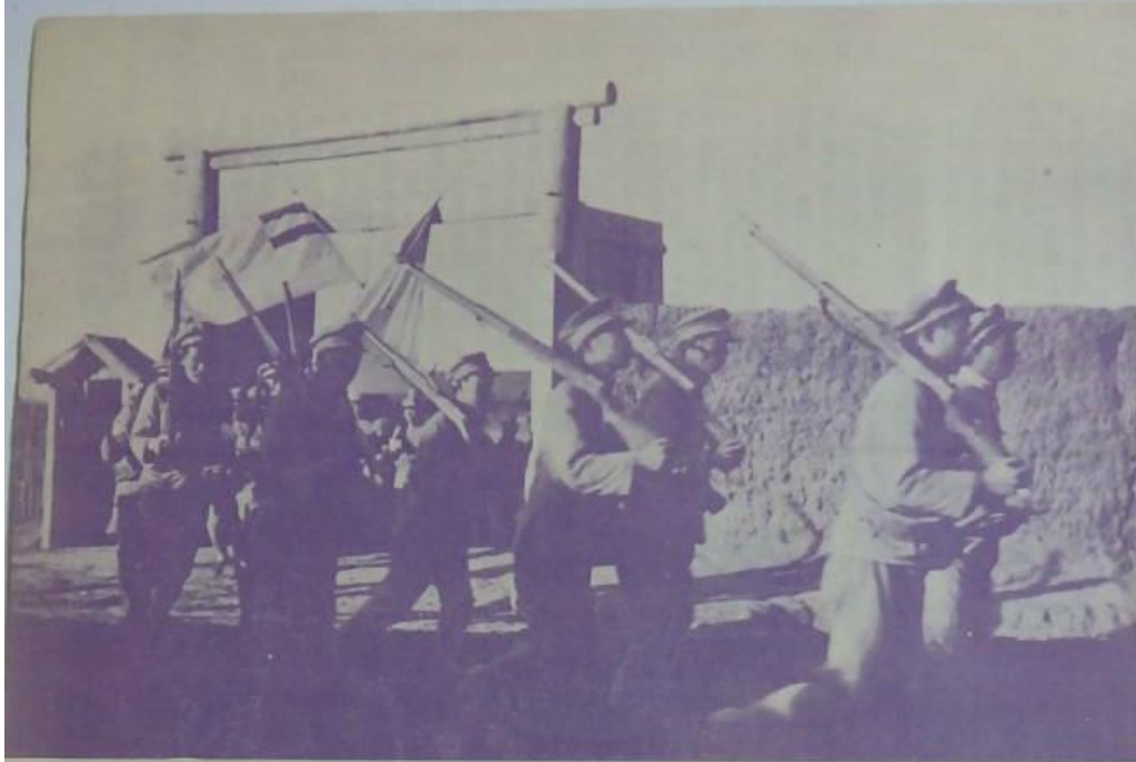
受命出動之自衛團