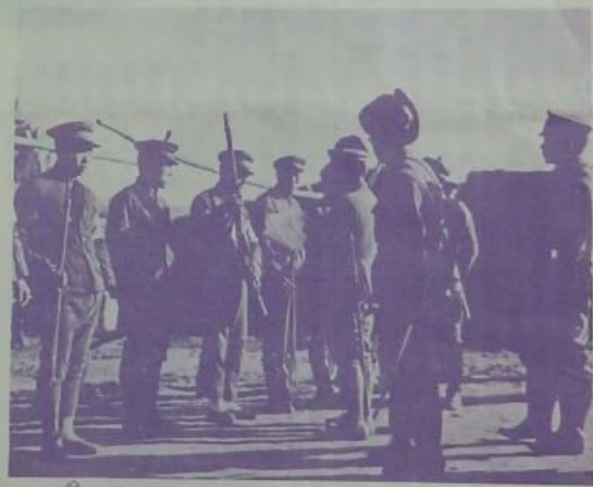
訓練之器材特事從下舉助於 自衛團之訓練器材特事從下舉助於 自衛團之訓練器材特事從下舉助於