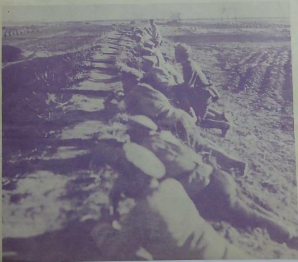
此種風對等之壕防實為勇敢之 戰術根據之尤重一在計之妥善