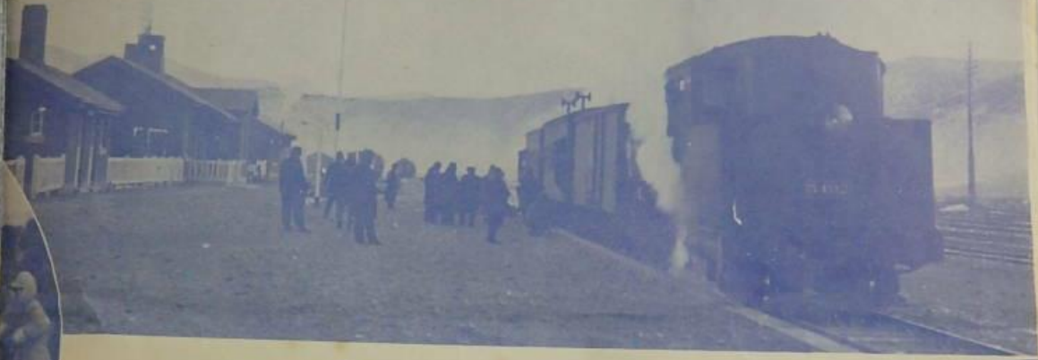
曾者六打一等大夫官大各國洲滿與人夫區大理總張 皇問問院病戎發京新赴問派名之會人編國帝滿日以 于若臨門慰贈各兵病傷之名百二對兼時回兵病傷軍