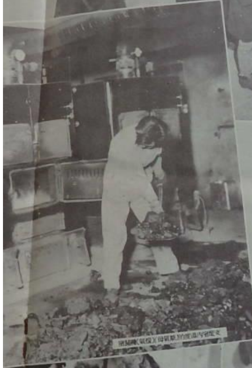
種穀種(氣保)母氣(氣)的度品內寄來