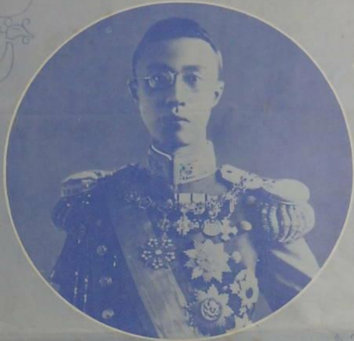
皇 帝 下 降 聖 照