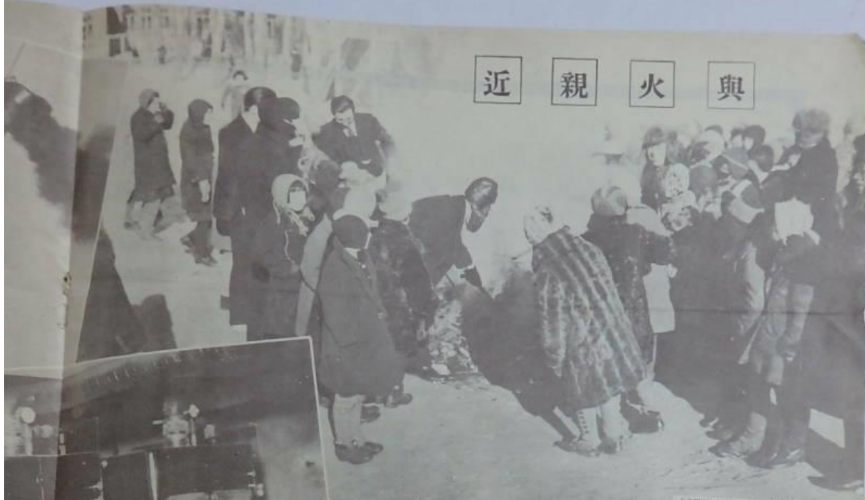
（之銀用軍器幼老列）大替之路時