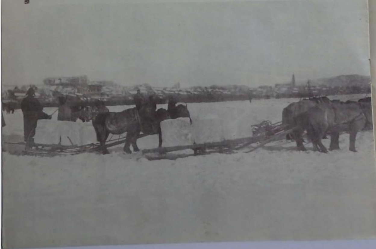
景光之社運運岩水由水瀨向馬郡用挽水之農墾 （林 首）