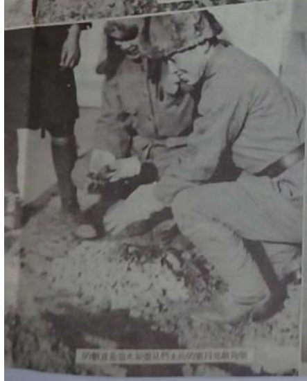
的數百是也本和面是們本共的數百和數百