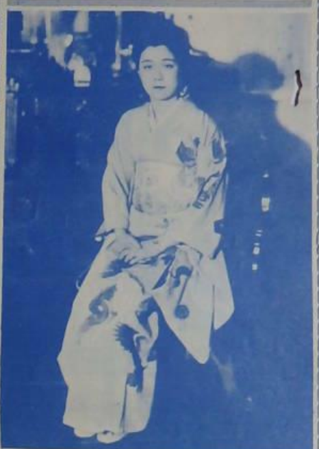
夫 問 訪 人 夫 一者 記 女一 人 夫 長 次 部 政 財 洪

日本前首相洪次部長夫人洪女士，最近在上海，記者曾到訪，談及中日兩國婦女之地位，及洪女士之生活，其言頗有裨益，茲將其言錄後，以供參考。