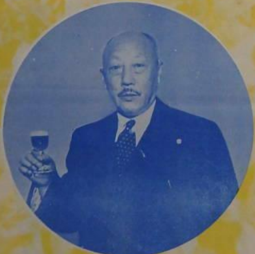
張學良與南滿洲鐵道株式會社代表