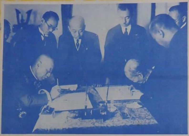
張學良與南滿洲鐵道株式會社代表