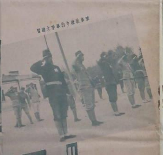
習練之手軍的軍隊軍事