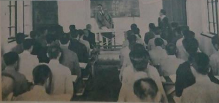
本字王國精神之訓練 我軍訓練之軍事