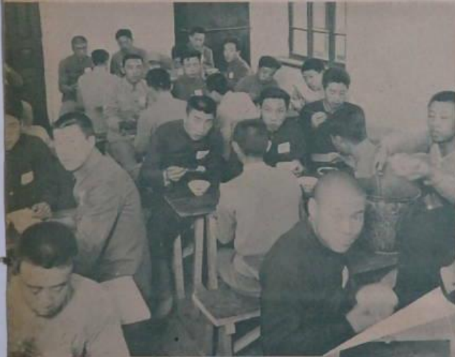
軍的訓練 心為了訓練可以實現