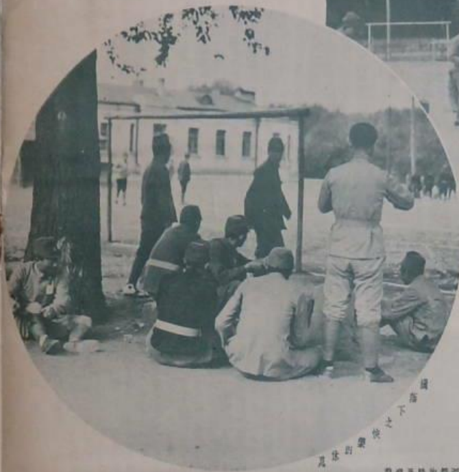
下 之 快 樂 與 健 康 之 體 操