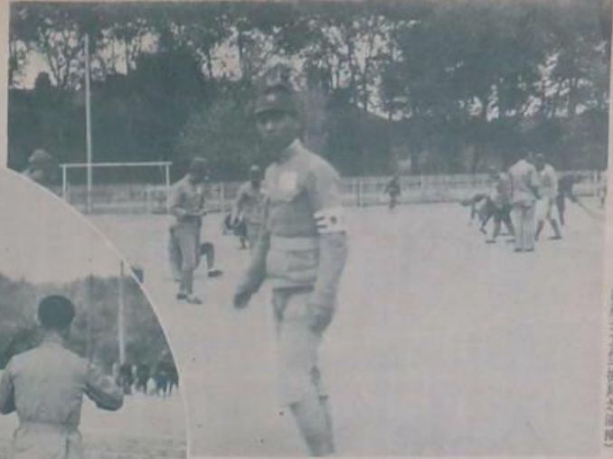
保甲青年訓練所之訓練

總之之可於組公業向有所保業企二訓 之之區各備著後建中牧者者圖十練此 建發請初職。國校容中云一預外者 建建等其村維成則精一者其所日之知 者者不村者表使使使及。一選舉。政新 矣。傳有。其之之之各以切放於獨立 團以無只成從難發請請四資。此來。地 其而難請見顧事務揭師十用。所以訓 任責對責其。於於於於於六魯。者有別 務之之之村都主保。具者保。成之之 非。中國之要組甲與之。公。乃為創 軍亦聚之練良編辦夜熱請師之由全立 而滿分組序好青事信心等。身難請以 具西子。然。年處聽的已現體青中康亦 大國市。與以於配。應所。練訓二保 者家。由。若凡各設及下長。學練練年甲 職業。出。國於此。編材於至。二。五。所。所。一。青 官。國。於。此。編。材。於。至。二。五。所。所。一。青 官。國。於。此。編。材。於。至。二。五。所。所。一。青