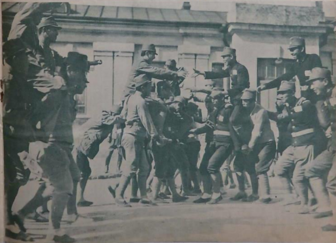
其保甲青年訓練所之訓練

總之之可於組公業向有所保業企二訓 之之區各備著後建中牧者者圖十練此 建發請初職。國校容中云一預外者 建建等其村維成則精一者其所日之知 者者不村者表使使使及。一選舉。政新 矣。傳有。其之之之各以切放於獨立 團以無只成從難發請請四資。此來。地 其而難請見顧事務揭師十用。所以訓 任責對責其。於於於於於六魯。者有別 務之之之村都主保。具者保。成之之 非。中國之要組甲與之。公。乃為創 軍亦聚之練良編辦夜熱請師之由全立 而滿分組序好青事信心等。身難請以 具西子。然。年處聽的已現體青中康亦 大國市。與以於配。應所。練訓二保 者家。由。若凡各設及下長。學練練年甲 職業。出。國於此。編材於至。二。五。所。所。一。青 官。國。於。此。編。材。於。至。二。五。所。所。一。青 官。國。於。此。編。材。於。至。二。五。所。所。一。青