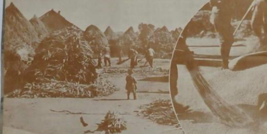
(1917) 秋收之收穫 (1918) 秋收之收穫