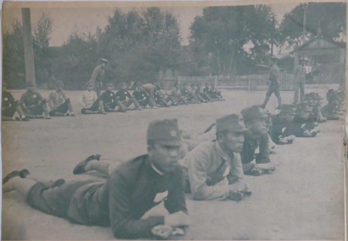
習練之軍隊的軍隊軍事