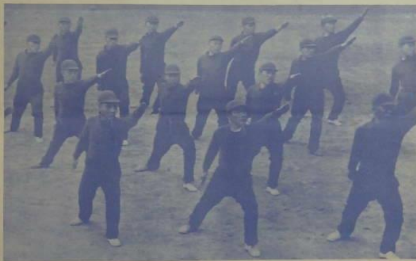
於新國民教育上，以體育為第一，體育生於此，實為一共同之生活，此乃該國所講之體育上之特色之一。