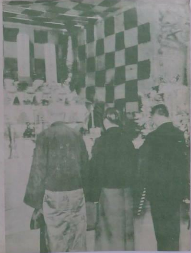
皇太子親王殿下隨員之聯席招待禮館內 氏(左) 中(右) 大(左) 外(右) 關(左) 日(右) 大(左) 禮(右) (左) 皇(右) 親(左) 王(右) 殿(中) 下(左) 隨(右) 員(中)

四月前皇太子親王殿下隨員之聯席招待禮館內 氏(左) 中(右) 大(左) 外(右) 關(左) 日(右) 大(左) 禮(右) (左) 皇(右) 親(左) 王(右) 殿(中) 下(左) 隨(右) 員(中)