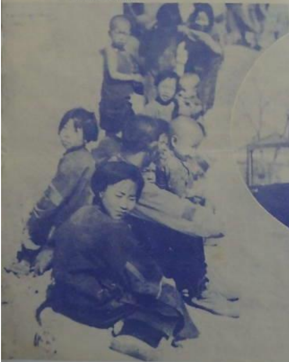
前所器事村和德山農動於 們家村之息休而光華惠江 。免見可無短之平和此