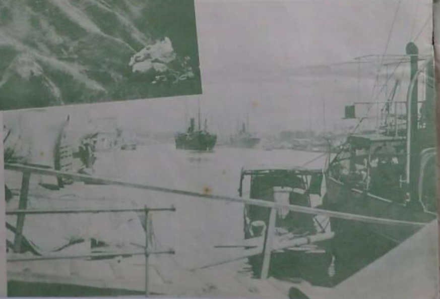
•中。形勢之門臨正北。上 城兵營與之堡固而新築滿結 河河自注天。下右(沈中平)中 滿亦其均向等上以形勢之形 隨了予官所使自總督軍團團 以進自軍兵等。在形之軍印 武備部之軍長