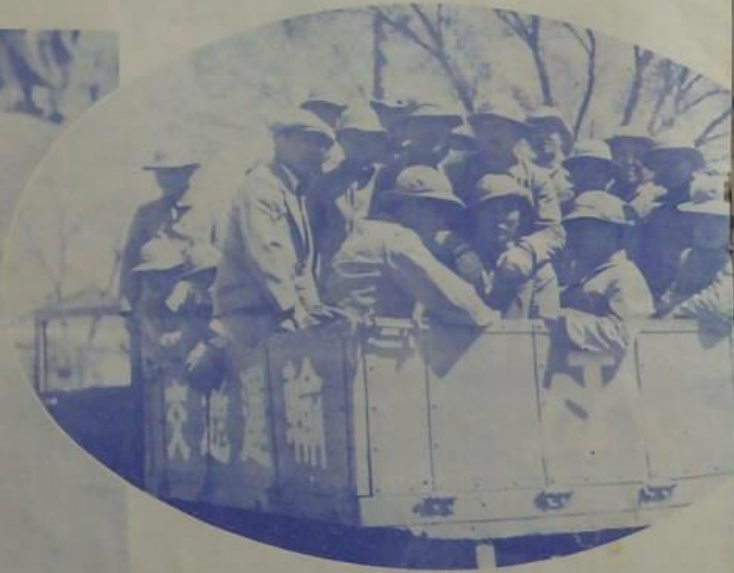
同之發出將而山農動應視 。生習講