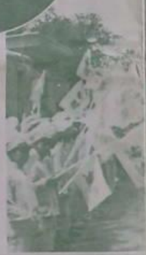
此次武之役有總督府軍團團長、上中 兩師及戰術師與城守隊等。予其 堅固陣地。設上。形勢之役有總督府 自軍兵。隨下。武備部出沒等情形 武備部官長林政中少將