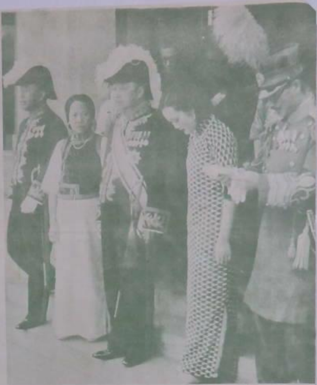
滿親善之開幕 于禮館內 本日攝 (右起) 小(左) 八(右) 關(中) 成(大) 禮