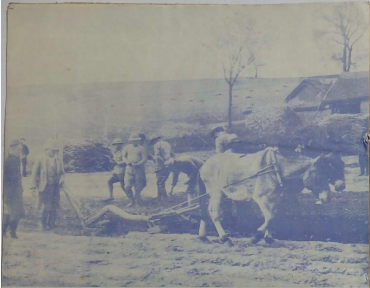
實村觀德山農動在日一之幸於生習講談 。景光之地田種耕夫農村該導指地