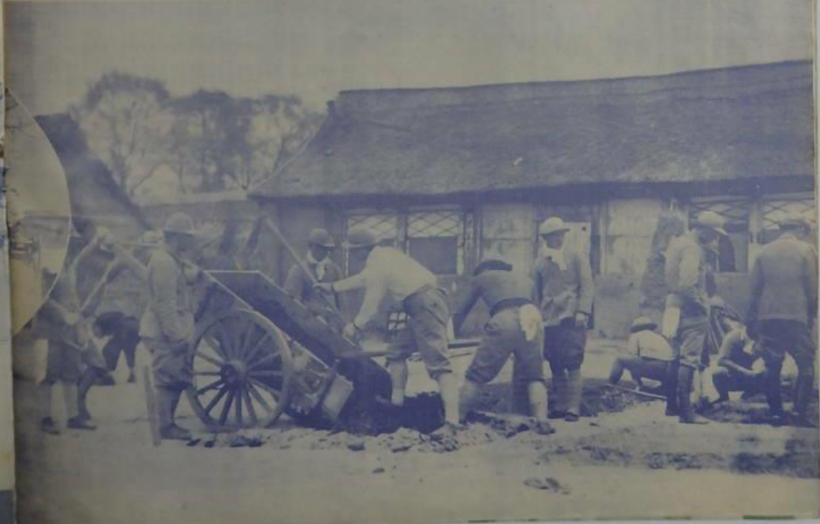
業員南技林農部業實 的繼模之生習講習所成 (山農動於)業作非新