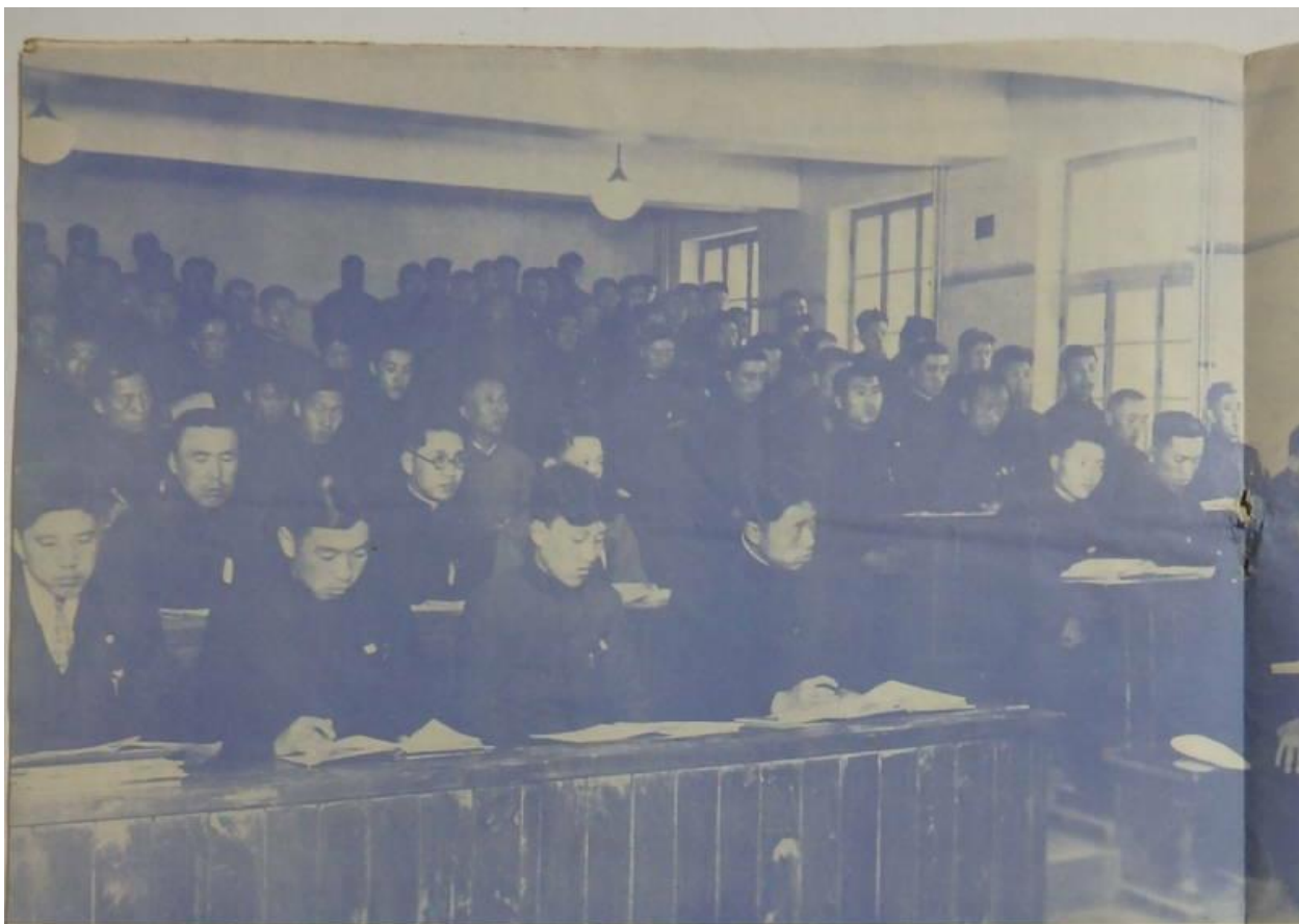
講的畫攝心熱光陽惠浴 (一之育教外校)門生習

之代時使政新思統以義講育教之所習講該 道王之代時家國新畫攝而思思育教的新至 悉即真寫。一之自目的要主為家印育教心 。門生習講的義講聞思心