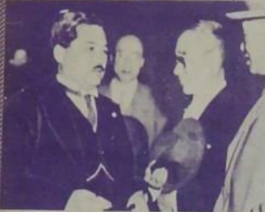
遠藤廳長於上週之目用提表上左 寫之後長地總廳 總務廳長向長向)於 正當左(務事代交長 氏藤遠之站車速大