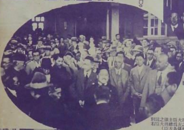
到臨之領主區大理總那館賓和大於 右區大理總為左之氏藤遠央中)會 (區大各區外長總務總新國民