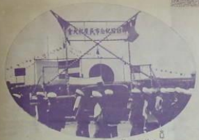
慶祝日軍大勝利大會