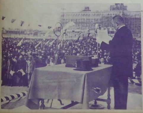
慶祝日軍大勝利大會