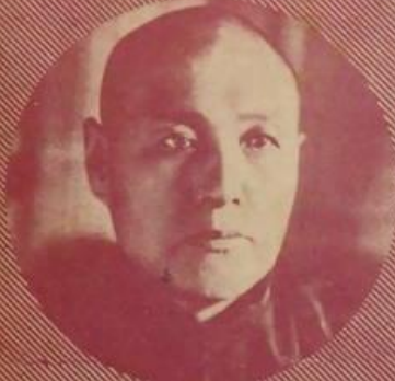
張際中 署大副總理