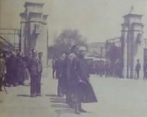
御訪日紀念慶祝大會