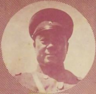
張山志 署大副總理