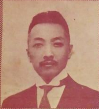
張清澗 署大副總理