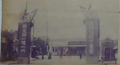
慶祝日軍大勝利大會