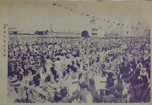
慶祝日軍大勝利大會