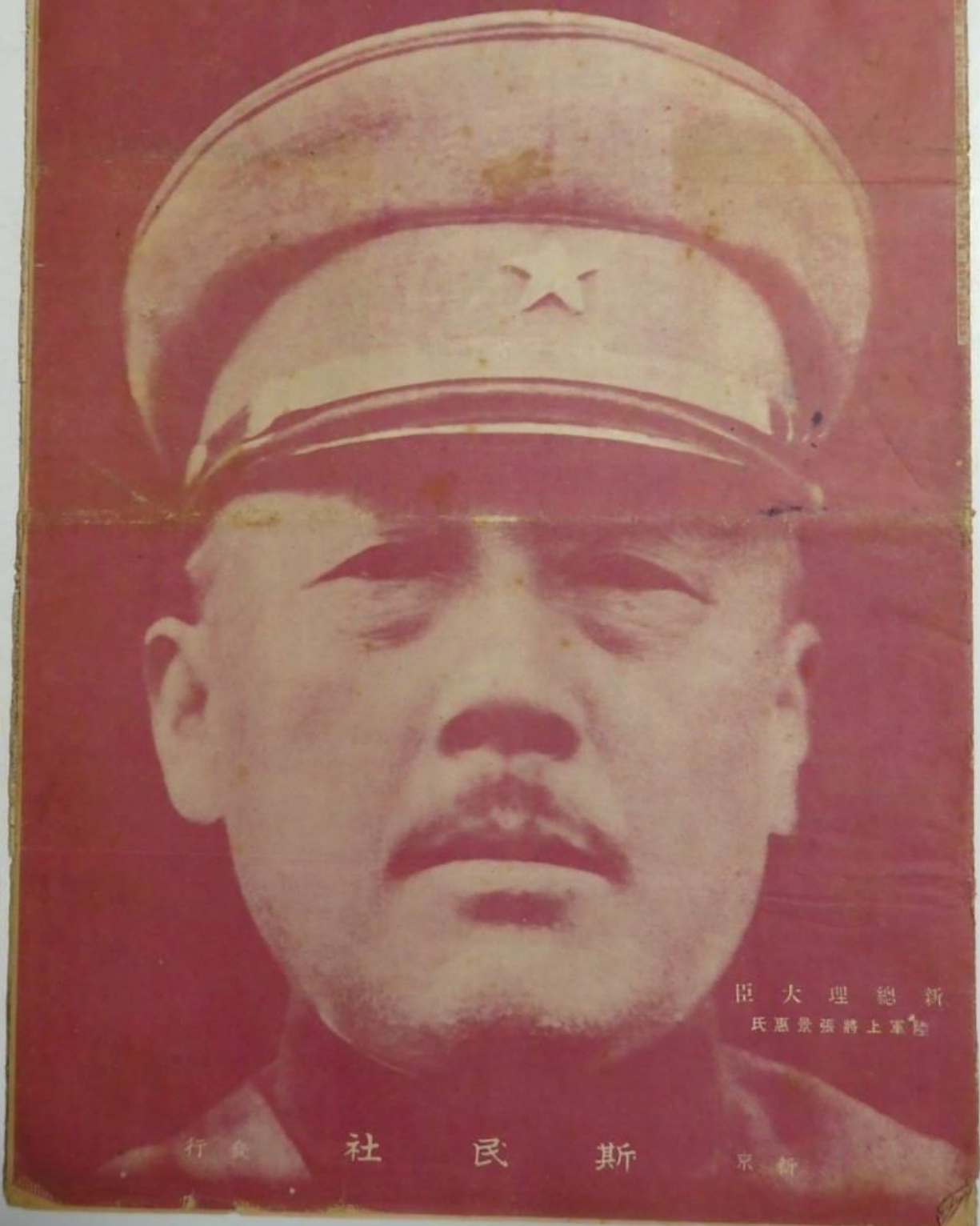
臣大 理總新 氏惠景張將上軍陸