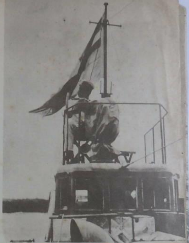
圖四四四上之江鴨黑於