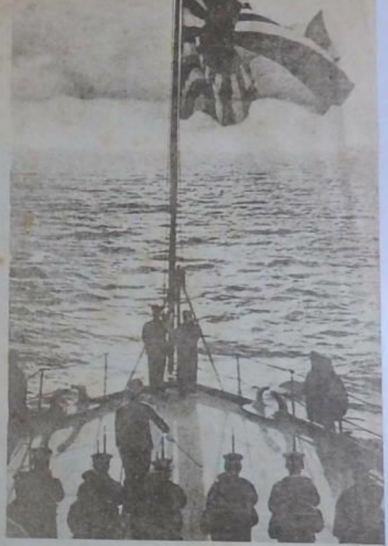
戰艦軍之旗國日艦