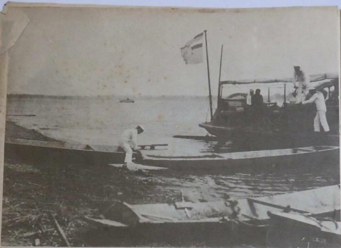
於海濱碼頭之中由海濱碼頭 (船之中心方前)船與船相離之此視