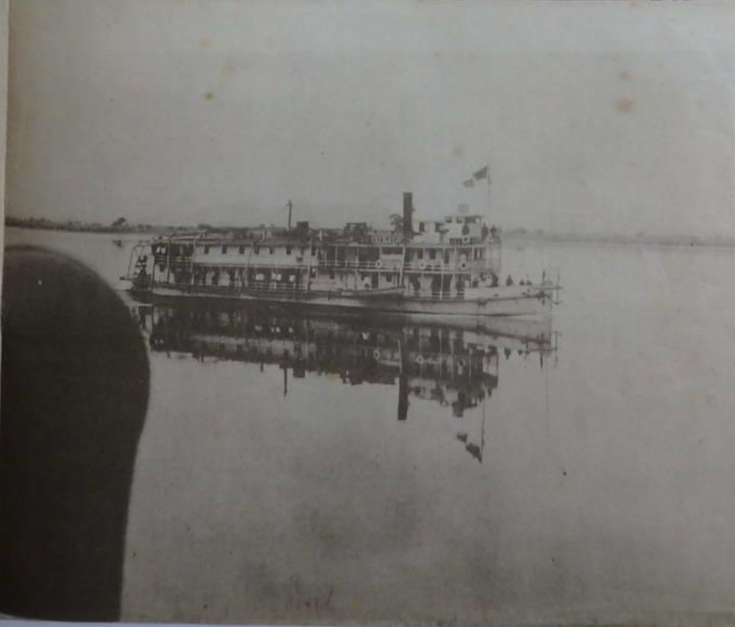
圖四四四下之江鴨黑於