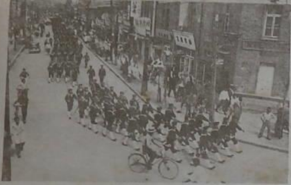
(市港大於)陸上之隊歡迎