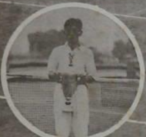
武田原之擊擊球選手權大會