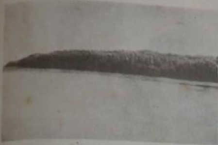
帶地針森之用商局