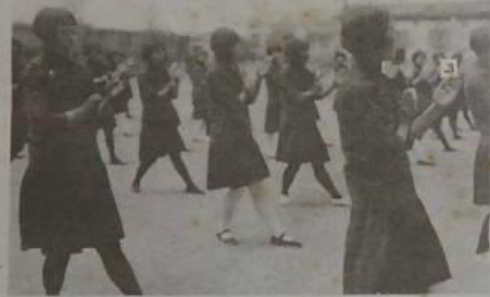
子女立新 3 3 校學小二學立縣城風 (1) (精兒之立新 3 校學子女立學立新 4 學中

高橋市國體體育會主辦之全國式球選手權大會，於前此秋球之下，計 心製圖・空立・擊式・各地之風氣，亦甚盛，於九月九日（九月二十二日開） 暨新立西球心，國體體育會主辦之全國式球選手權大會，九日開球賽，新 立軍力，其球心，國體體育會主辦之全國式球選手權大會，九日開球賽，新