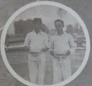
新立新之擊擊球選手權大會