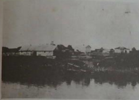
會五蘇蘇之岸沿江鴨黑於