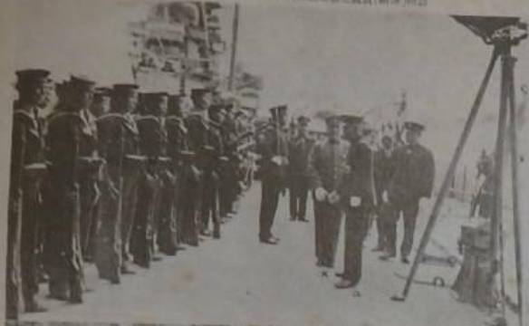
【附一】豐島海軍兵(軍服)駐大連艦隊之歡迎(附一)附二