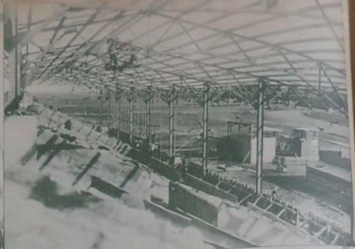
場武興大武武的步理理工