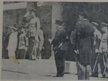
下等軍官之訓練所...