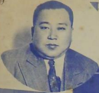
區大部政民呂長局務事央中新 區大理總張長會新