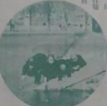
日本新報社的公圖