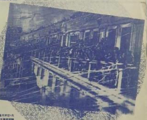
「春日之壯觀景象」... 「春日之壯觀景象」... 「春日之壯觀景象」...