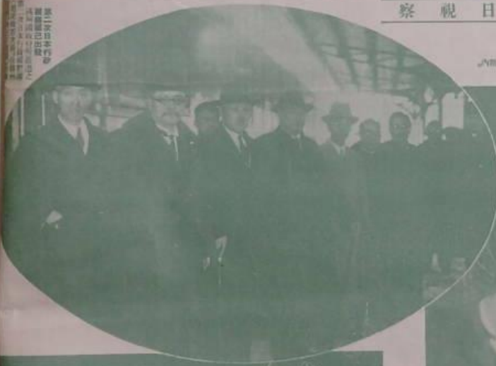
赴日視察團成員合影

【本報訊】赴日視察團成員合影，成員包括外交部官員及各界人士。視察團成員合影，成員包括外交部官員及各界人士。視察團成員合影，成員包括外交部官員及各界人士。