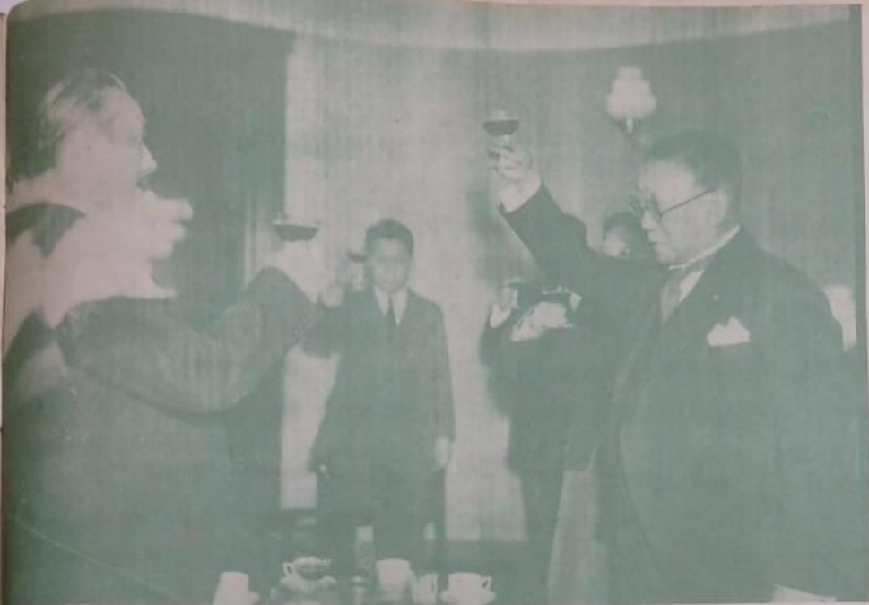
某國駐華公使與我外交部官員在宴會中致意

【本報訊】某國駐華公使與我外交部官員在宴會中致意，場面熱烈。公使與我外交部官員在宴會中致意，場面熱烈。公使與我外交部官員在宴會中致意，場面熱烈。