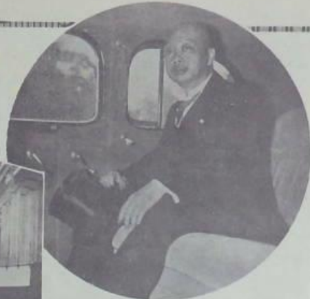
前皇自天在皇曾日一十二月上使大御之儀神禮之 當官與拜，榮光之會神與以瑞和明德內宮於下陸海 使大御之禮車動自之內皇於日

陛下親臨，幸以萬國博覽會開幕式八日，總年三十餘年日本， 繼八次在牛在如中月上於色真露此。行舉之舉神與由須原有助年 形禮之高神現與的行舉所