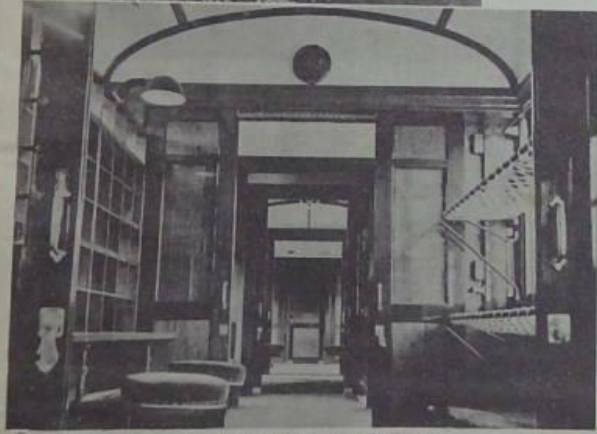
便館內全用開設之成完出車地地專員者信通本日 (圖其一解一覽造樣其)，車