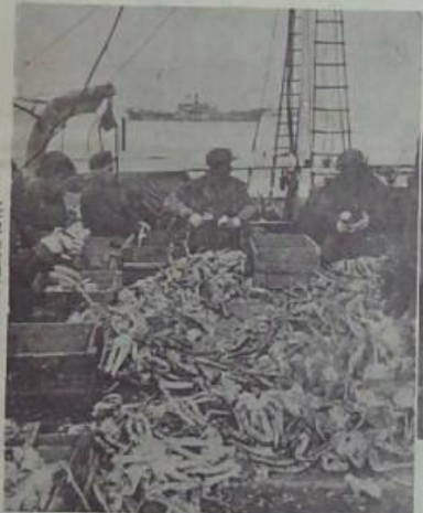
六十年皇曾日一十月