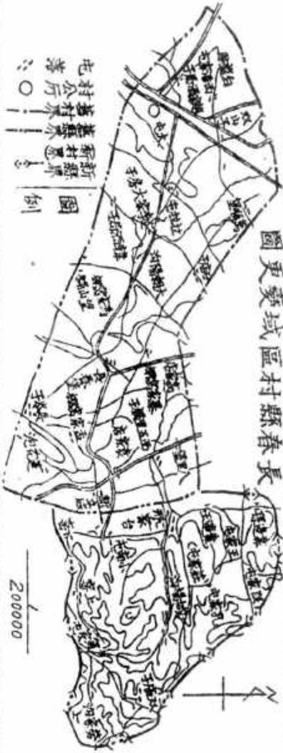
長春縣區域區變更圖