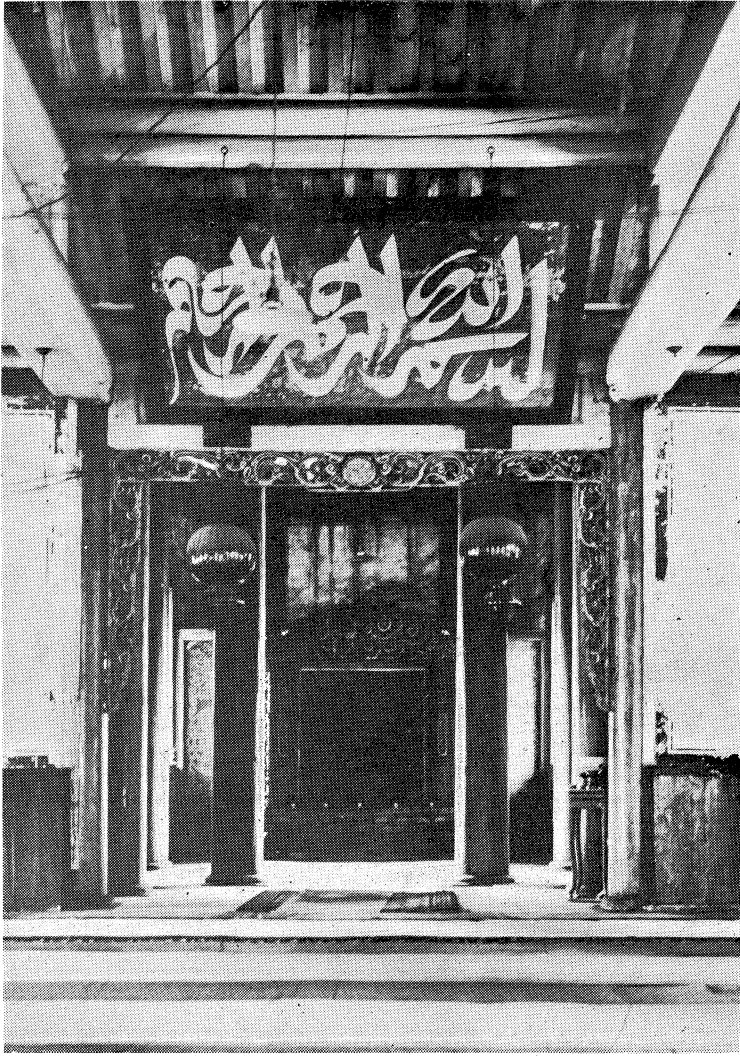
奉天・南清真寺、ミハラブを望む。