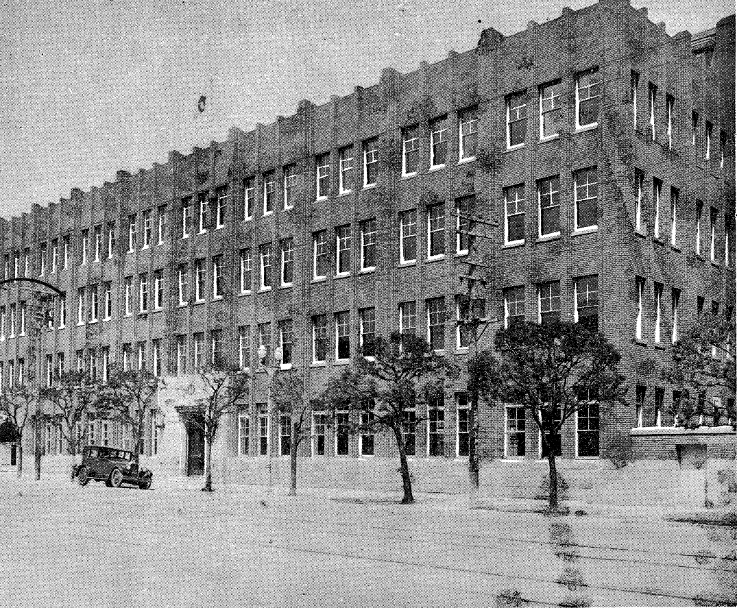
大連汽船株式會社・外觀