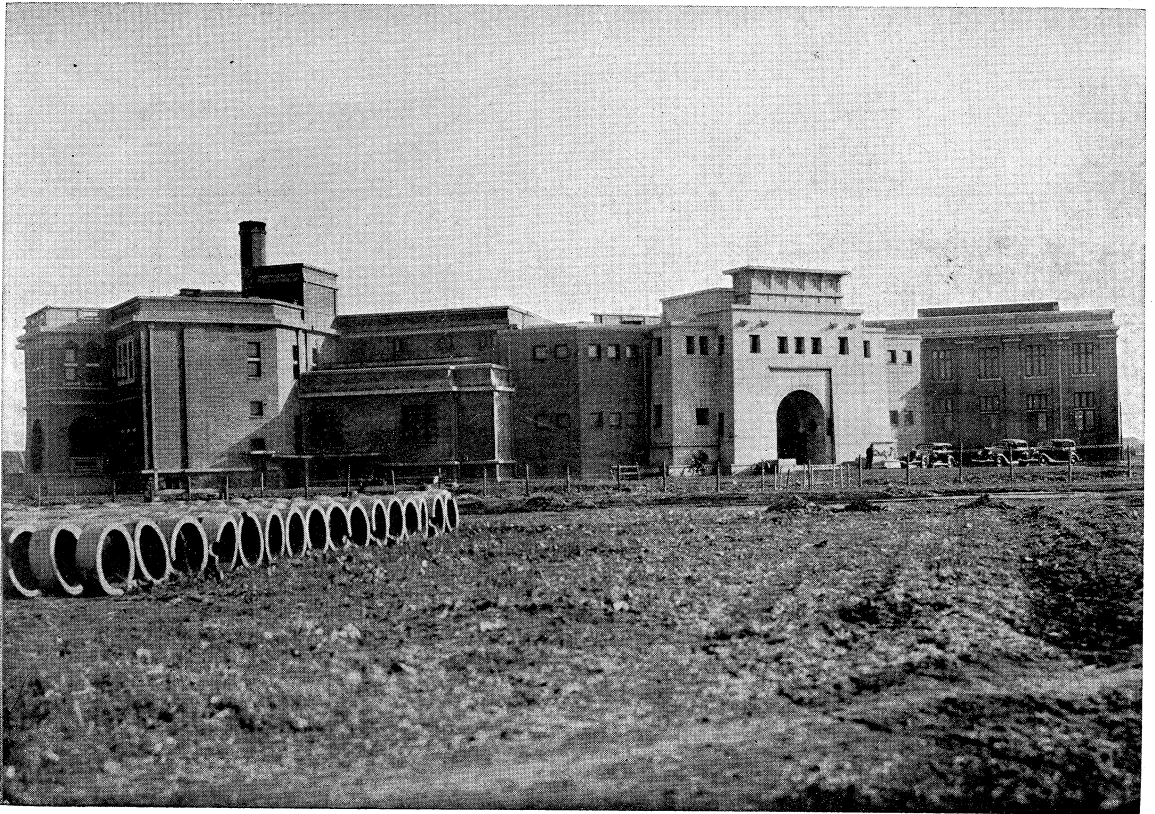
上、背 面 下、正 面