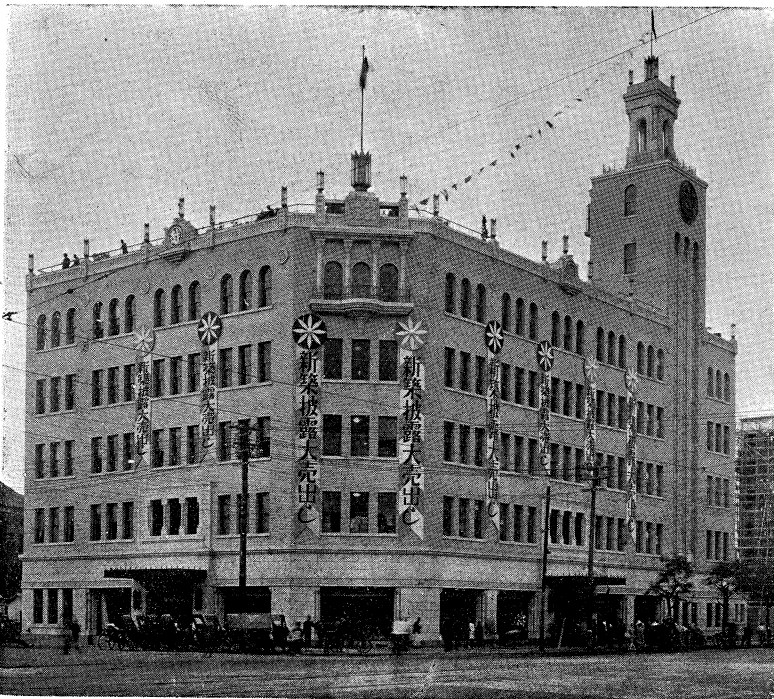
下、東北より見たる全景