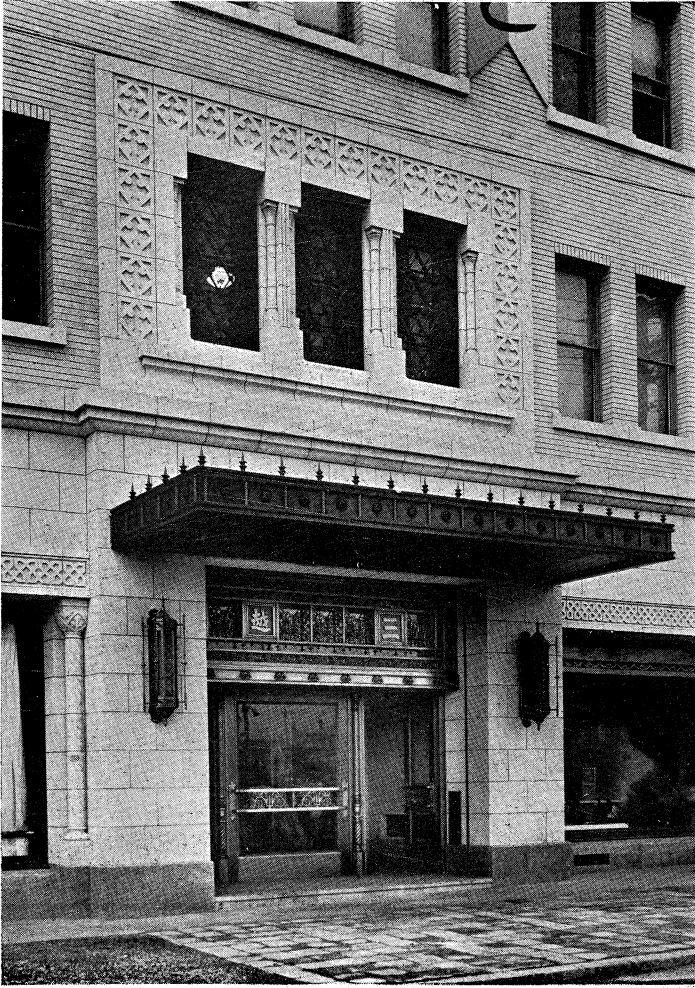
4階 食 堂 電 燈