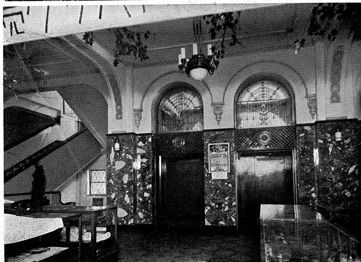
上、正面玄関廣間 下、1階エレベーターホール