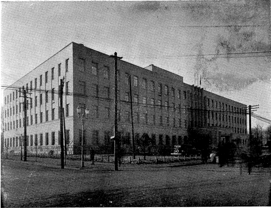
上、外 觀 中、用度科事務室 下、會議 室