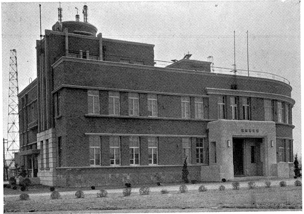
上、西側より見たる全景 下、北側より見たる全景