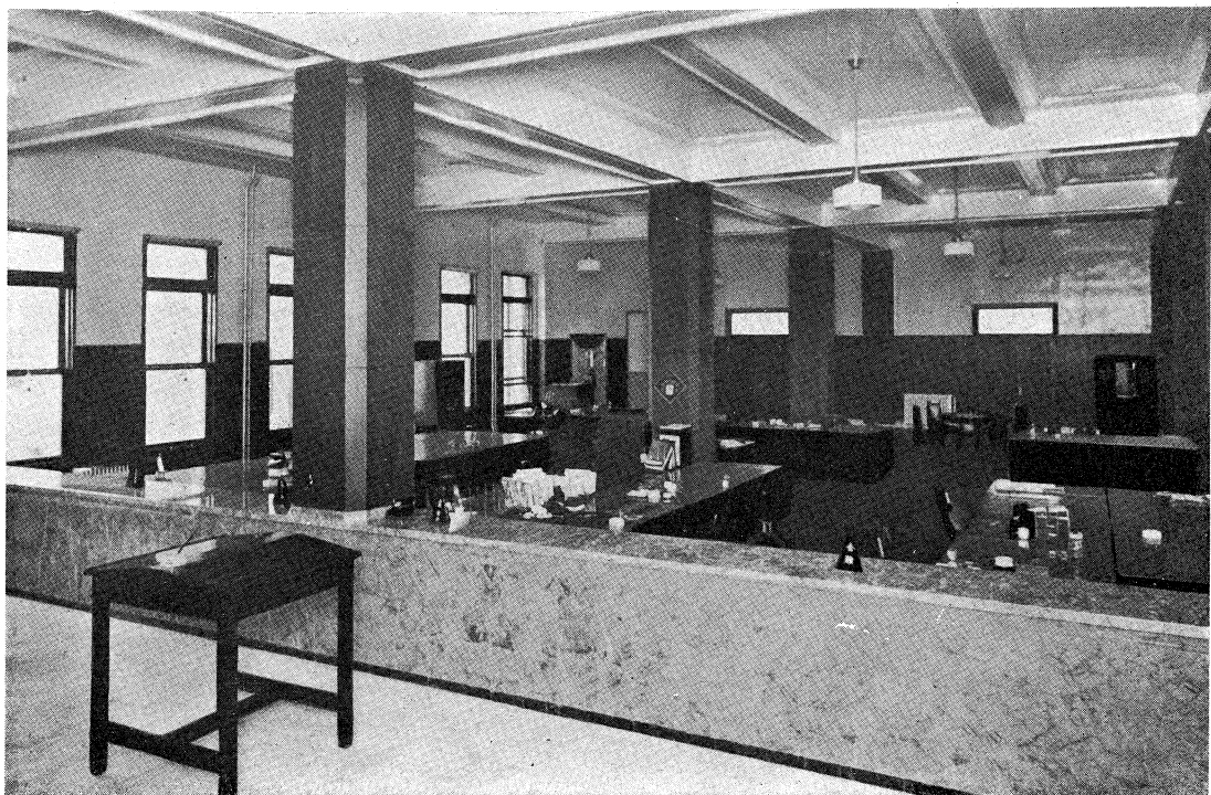
新京東拓ビルディング