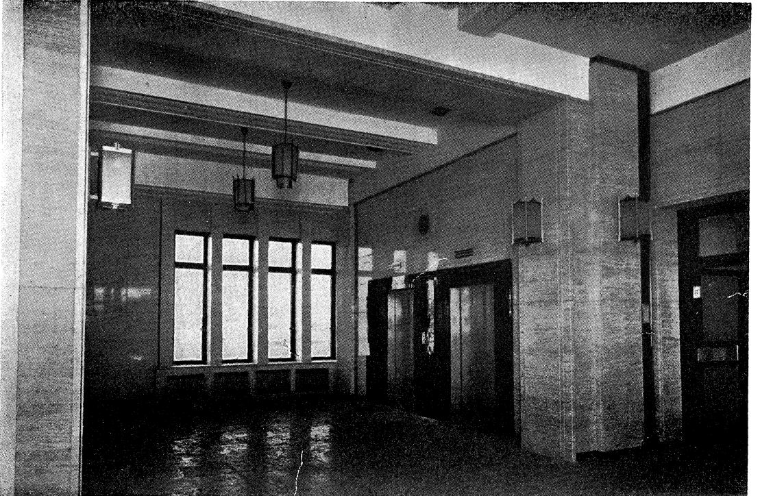
新 京 東 拓 ビ ル デ イ ン グ