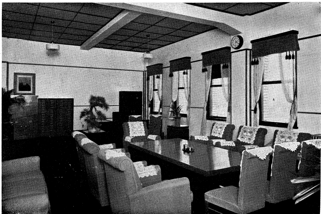
新京東拓ビルディング